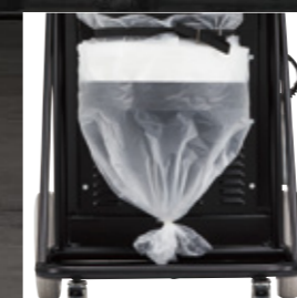
ホコリをまき散らさず、簡単に 封じこめるロングオバック方式。