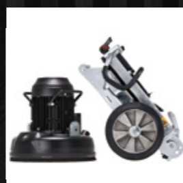
モーターとシャフトを簡単に 分離し、折りたんで運搬。