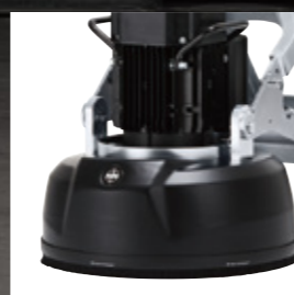
不陸に追従した集塵カバー。