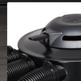
塵落とし機能搭載。