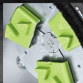
EZchange™システムはダイヤの 取付と交換がスピーディーに。