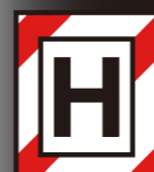
安全のためのH定格シリーズ 最高の国際規格「H」を満た しています。