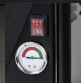
フィルターの清掃及び交換 時期が明確にわかります。