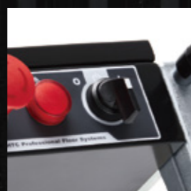
ワンボタンで研削をスタート。