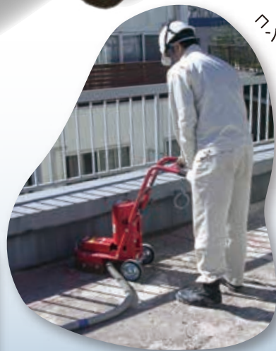
7.6メートルだから小回りバツグン