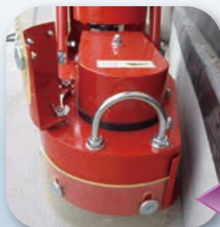
カバーの一部を外して 際 きわ の作業もできる