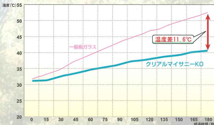
◆ 一般板ガラスと『クリアルマイサニーKO』施工ガラスの温度差比較試験

熟練のコーティング技術で高品質！！ 一般ガラスと比較すると 11.6℃の差！！！！